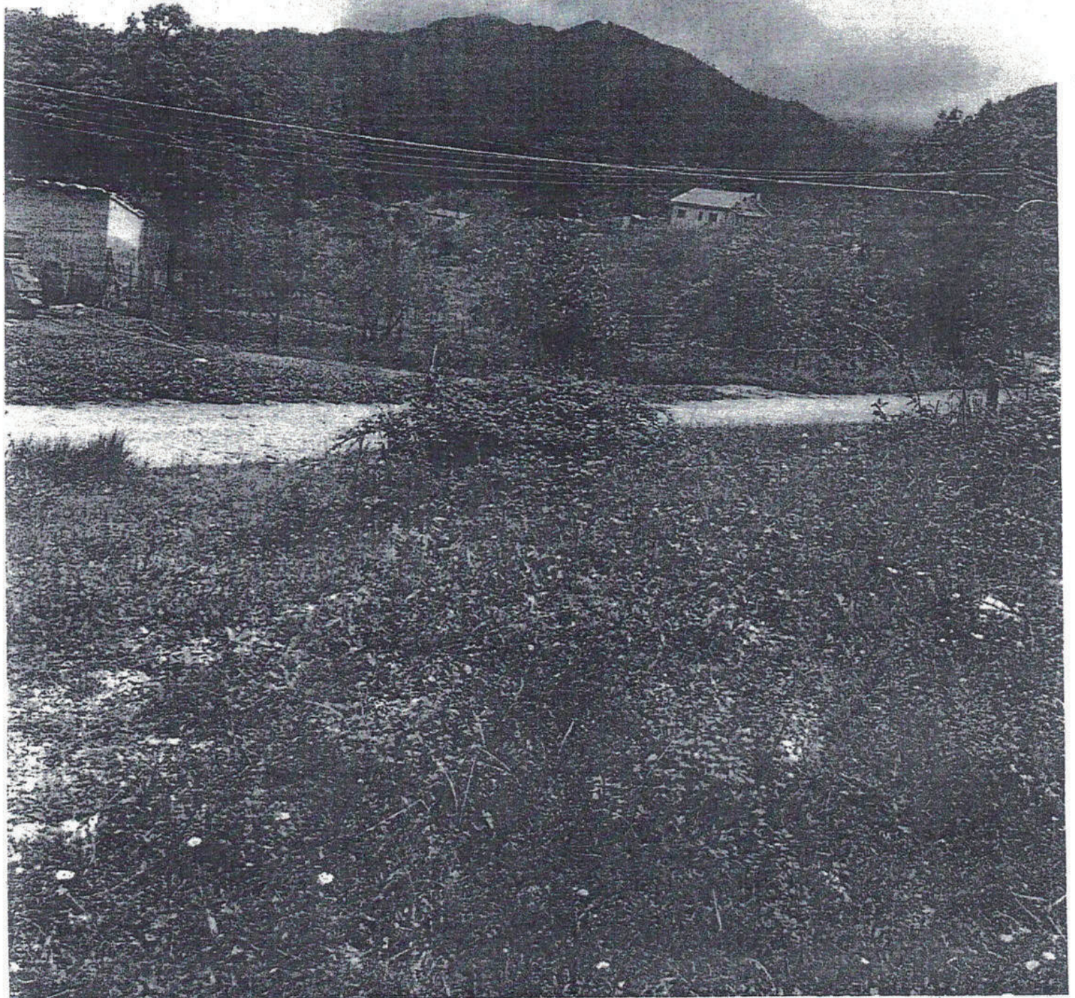
ALLEGATO n. 3